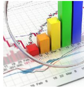
Excelência nos serviços